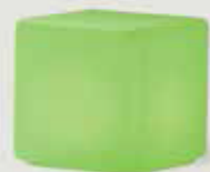
LED TABURE količina: 10