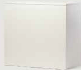
INFO PULT IVERAL