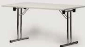
KONFERENČNA MIZA 140x80 (zložljiva) količina: 60