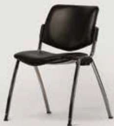
KONFERENČNI STOL ČRN količina: 930