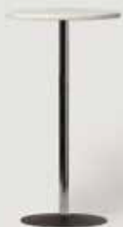
BARSKA MIZA BELA D60 količina: 25