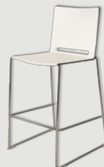
BARSKI STOL BEL količina: 30