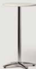
BARSKA MIZA BELA 2 D60 količina: 20