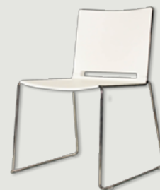
KONFERENČNI STOL BEL količina: 80