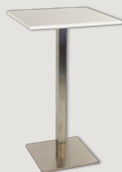
BARSKA MIZA KROM količina: 10