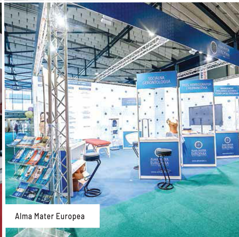
Alma Mater Europea