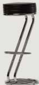
BARSKI STOL KROM količina: 120