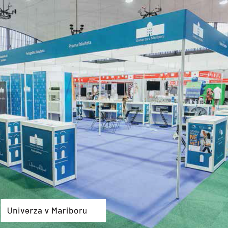
Univerza v Mariboru