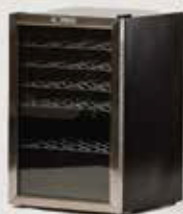
HLADILNIK ZA VINO količina: 50