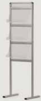
STOJALO ZA PROSPEKTE (do A3) količina: 2