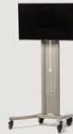
LCD TELEVIZIJA količina: 6