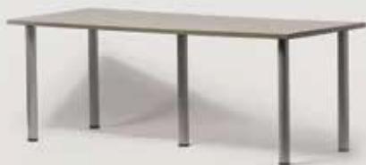
KONFERENČNA MIZA 200x80 količina: 30