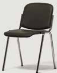
KONFERENČNI STOL SIV količina: 490