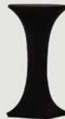
PRT ZA BARSKO MIZO ČRN količina: 10