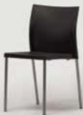
STOL BIKINI količina: 15