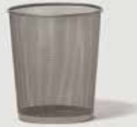
KOŠ ZA SMETI, OKROGEL ALI KVADRATEN količina: 50 (okrogli), 80 (kvadratni)