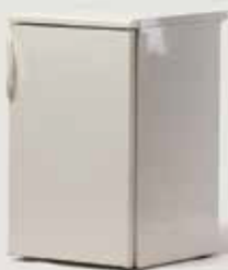
HLADILNIK 120I količina: 16