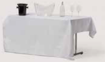
PRT (BEL) 180x180 količina: 500