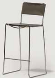
BARSKI STOL A 22 količina: 30