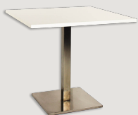
MIZA KVADRATNA KROM količina: 20