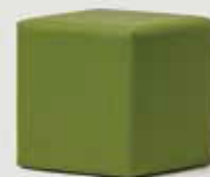
TABURE, ZELEN količina: 10