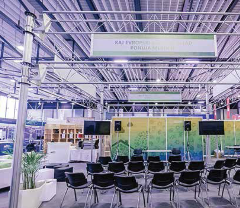
Služba Vlade RS za razvoj in evropsko kohezijsko politiko