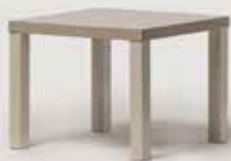
KLUBSKA MIZICA 55x55 količina: 6