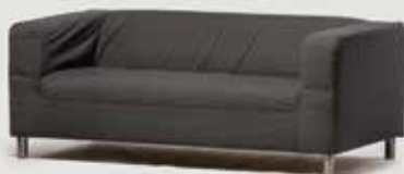
TROSED količina: 6