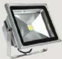
LED REFLEKTOR količina: 180