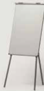
TABLA PIŠI-BRIŠI (tudi z listi) količina: 10