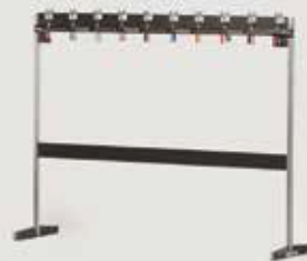
KONFEKCIJSKO STOJALO količina: do 800 kosov garderobe