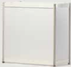
INFO PULT OCTA (BEL ALI SIV)