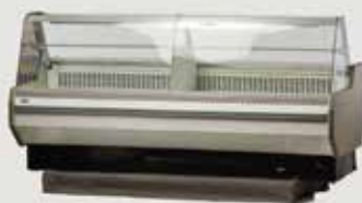
HLADILNA VITRINA 197x102x120 količina: 2