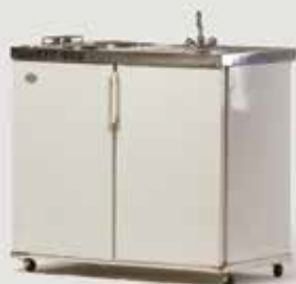
MINI KUHINJA (80 l, bojler) količina: 9