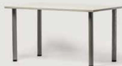
KONFERENČNA MIZA 140x80 količina: 70