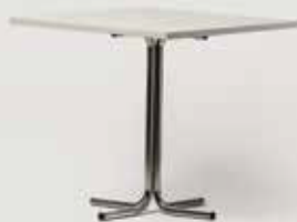
MIZA, KVADRATNA 80x80 količina: 80