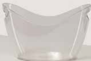
POSODA ZA LED, STEKLENICE količina: 300