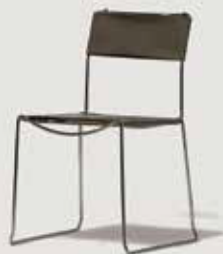
STOL A 20 količina: 160