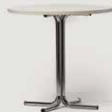
MIZA, OKROGLA D80 količina: 20