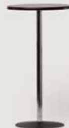
BARSKA MIZA ČRNA D60 količina: 20