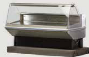
HLADILNA VITRINA 260x97x120 količina: 1