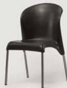
KONFERENČNI STOL ALPOS količina: 130