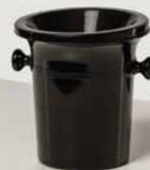
ODLIVALNIK količina: 300