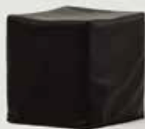
TABURE, ČRN količina: 25