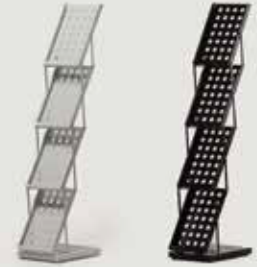
STOJALO ZA PROSPEKTE (do A4) količina: 5 (beli) 5 (črni)