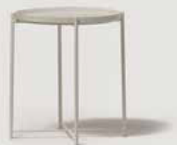
KLUBSKA MIZICA, KOVINSKA količina: 6